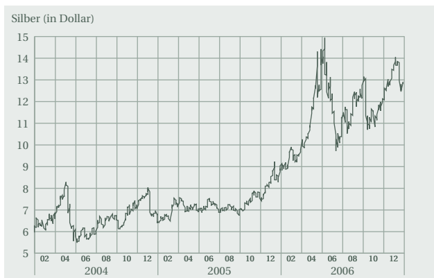
Entwicklung des Silberpreises in Dollar 01.01.2004 bis 31.12.2006

tig. Wir gehen unverändert davon aus, dass die alten Höchststände von 850$ in den nächsten Jahren überschritten werden. Gleichzeitig halten wir auch Silber für ein langfristig hochinteressantes Investment, da die Notenbanken kaum noch über Reserven verfügen